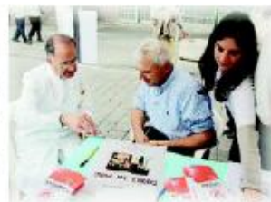
Due momenti delle iniziative per sensibilizzare i cittadini al problema dello scompenso cardiaco

Fino all'8 maggio sono in programma una serie di eventi dedicati alla salute del cuore: «Speriamo di riuscire a met-