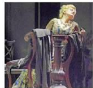
L'ARTISTA Il soprano Fiorenza Cedolins nel ruolo di Fedora e una scena dello spettacolo